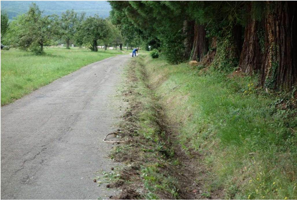
Zur Rodung gehört auch die Rinne und dann wieder die Straße