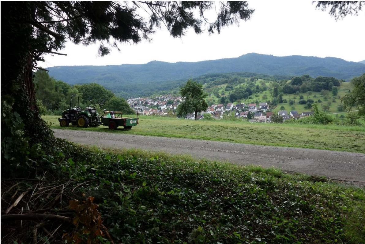
So sieht man Michelbach vom neuen Abschnitt aus