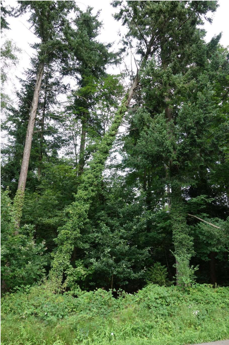
Bäume hängen schief und noch ist alles zugewachsen.