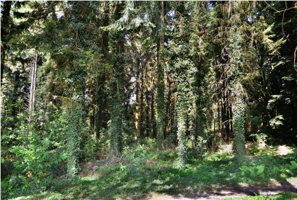
Wir sind nicht in einem Urwald!