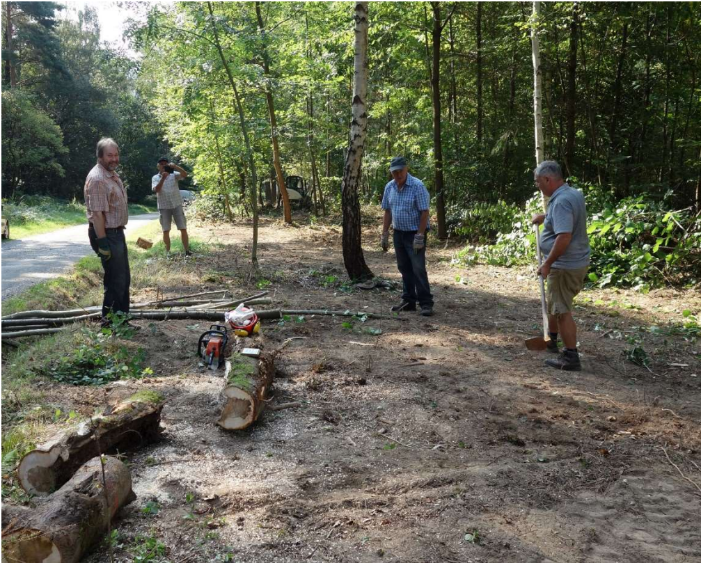
Ohne Handarbeit ist es nicht zu machen