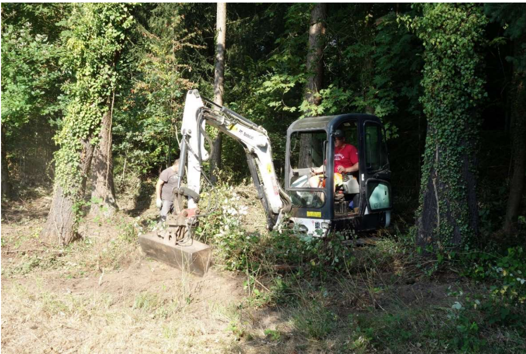
Unterstützung mit dem Bagger durch die Bauhof Mitarbeiter der Stadt Gaggenau