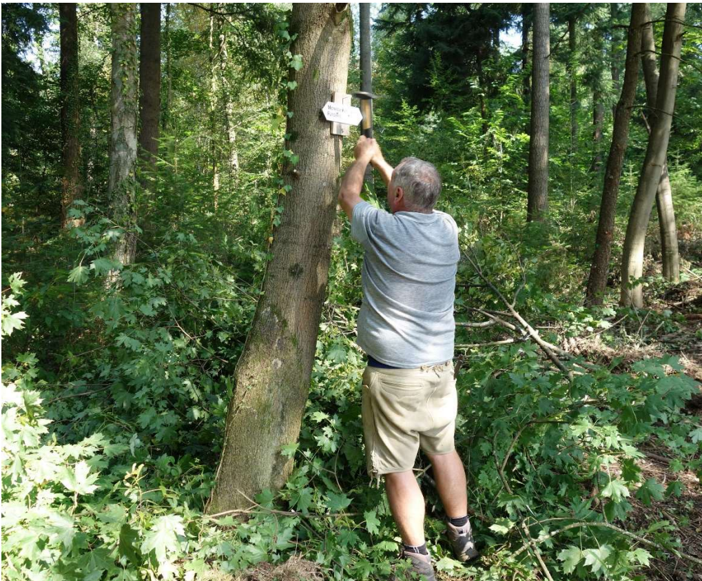
Mit dem ersten Rundwegschild ist die Freigabe erteilt worden.