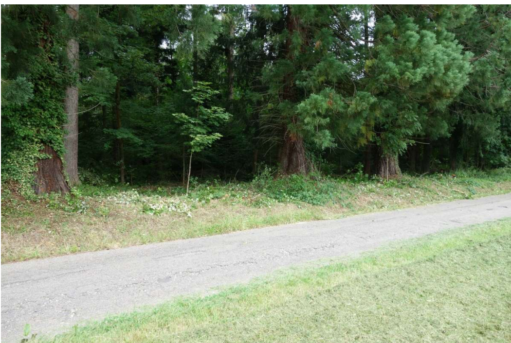
Erste Freilegungen sind zu erkennen