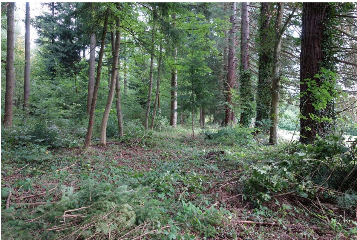
Zugang vom vorhanden ersten Abschnitt zu Beginn der Freilegung