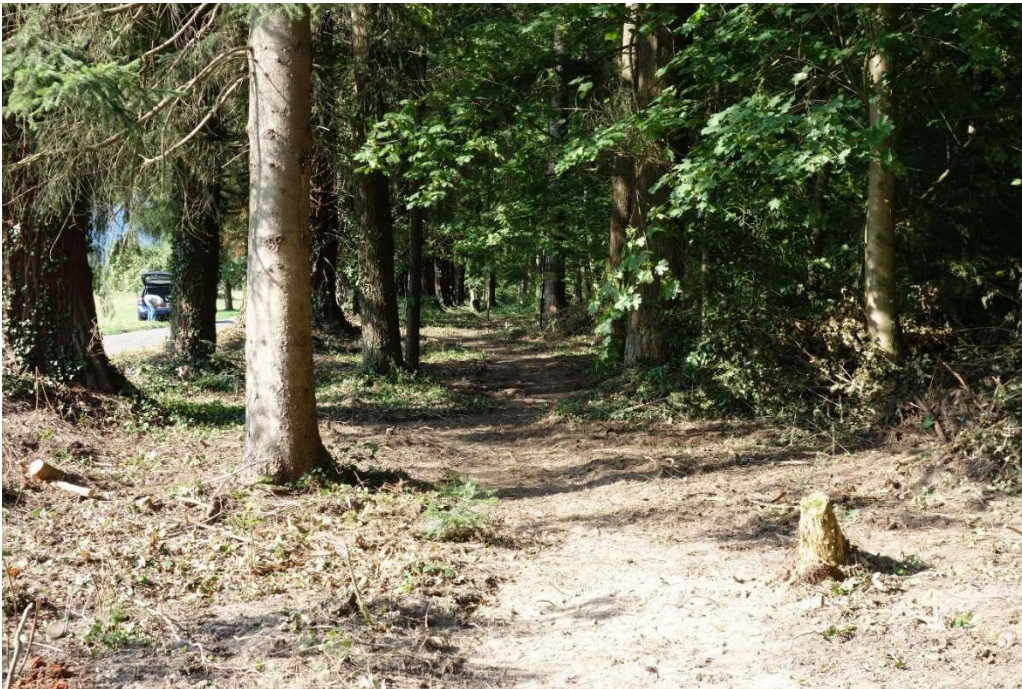
Hier war der Bagger schon aktiv.