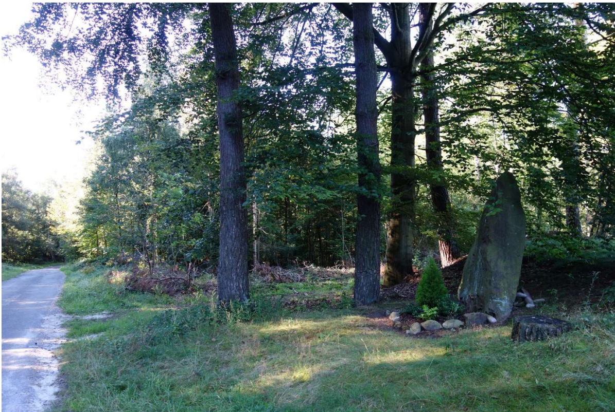
Zugang vom Sportplatz ist noch „Wildnis“