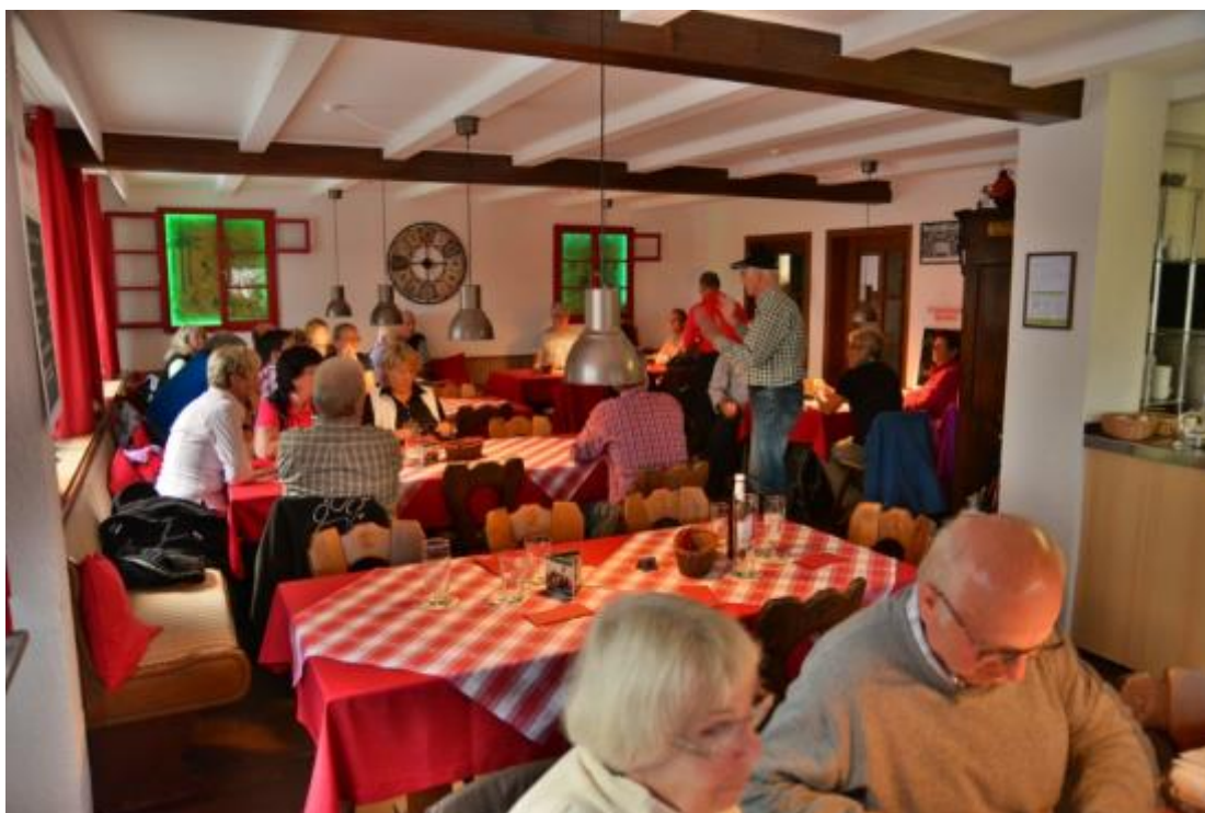
Die Teilnehmer am Ende im Naturfreunde Haus