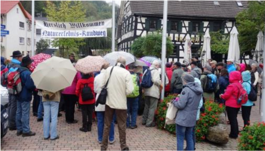
Die Gaeste treffen ein und sammeln sich am Lindenbrunnen