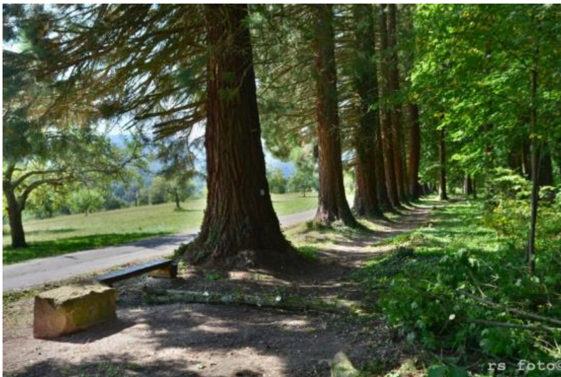
Beim Exotenwald am Baumpfad in Eberts Garten