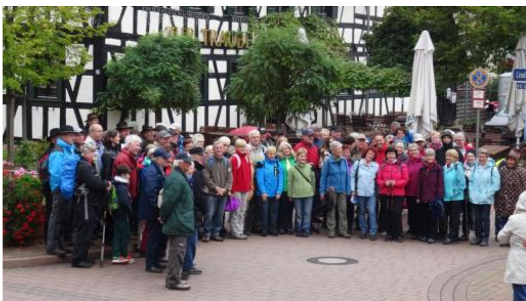
Auch der RF Sprecher steht in der Gruppe