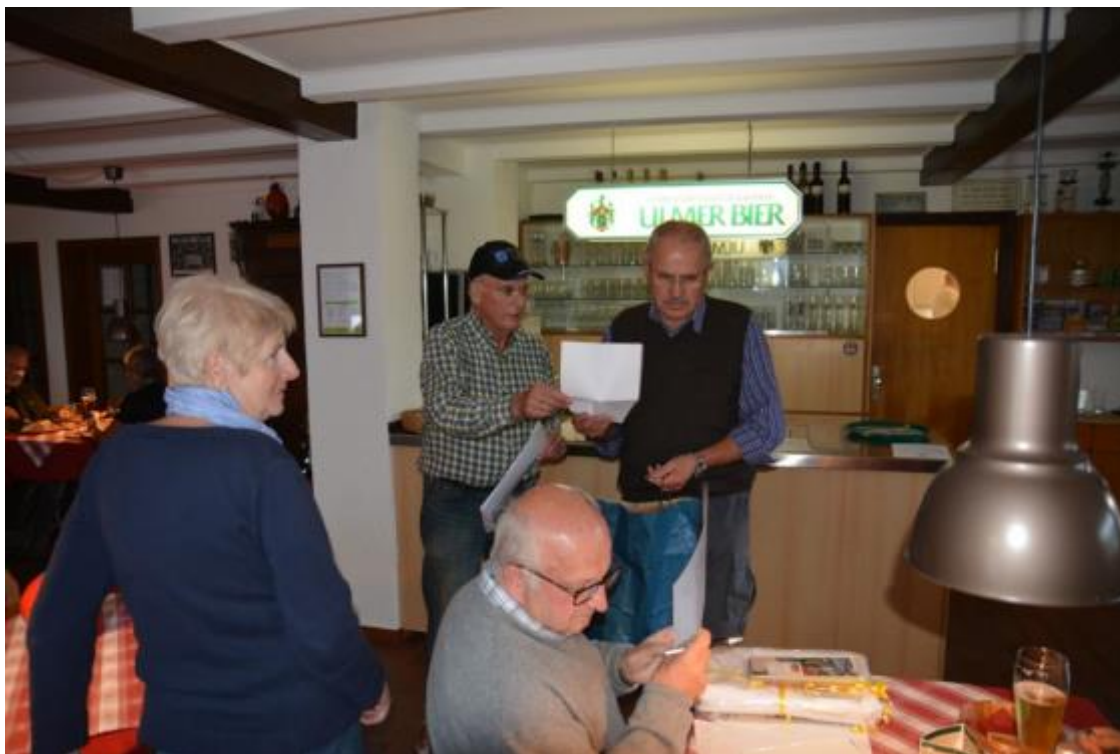
Das Team der RF mit dem Quiz und den Gewinnen und Gewinner die notiert werden.