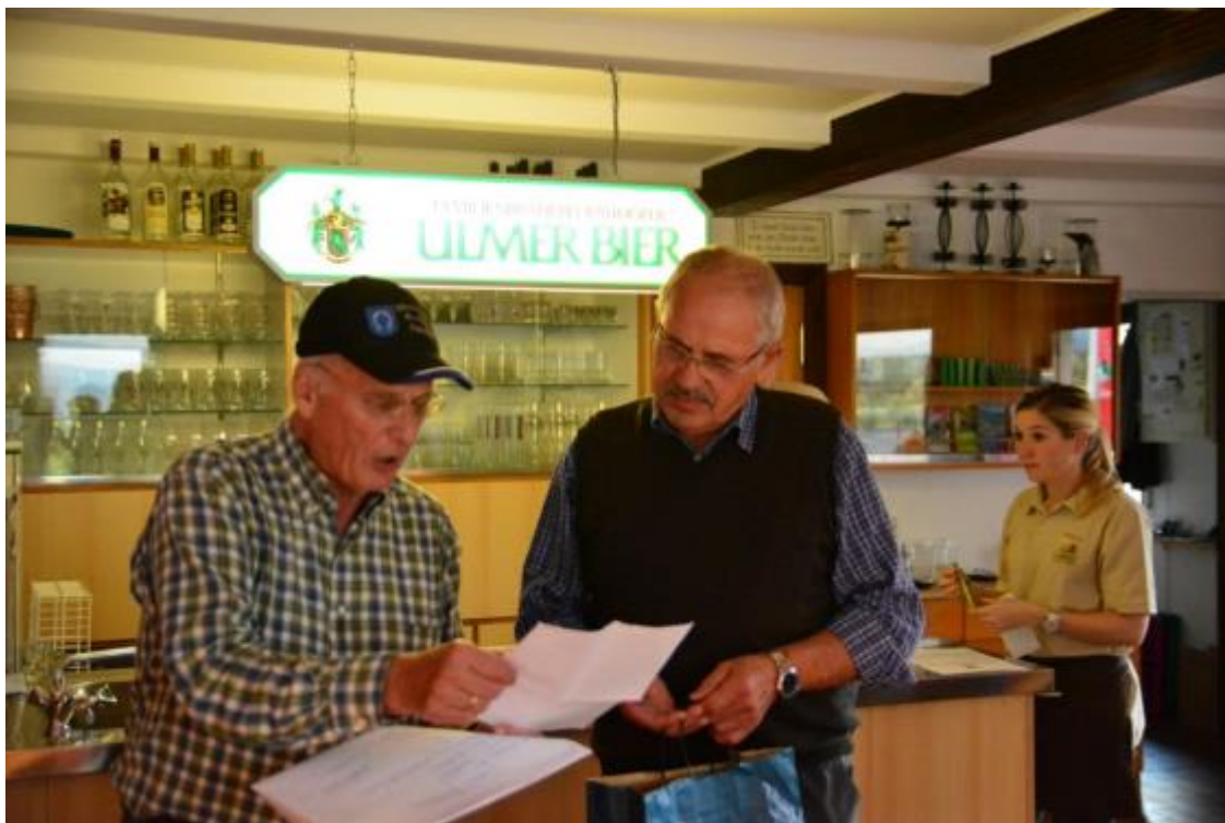
Die Gewinner des RF Quiz werden gezogen