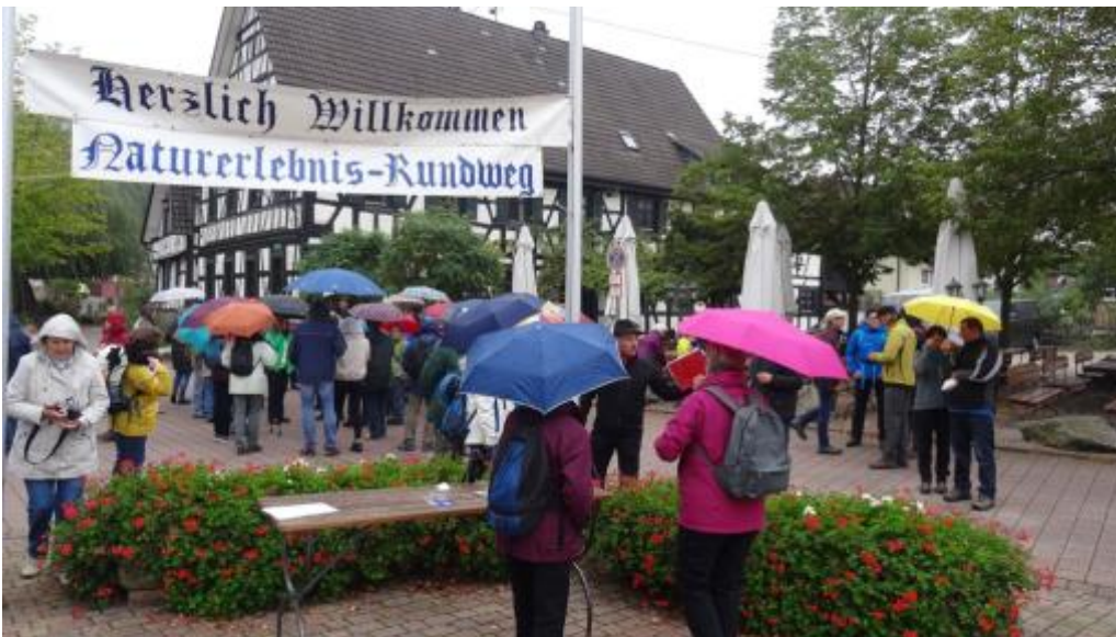
Der kurze Regen hat alle etwas erschrocken und die Regenschirme wurden aufgespannt