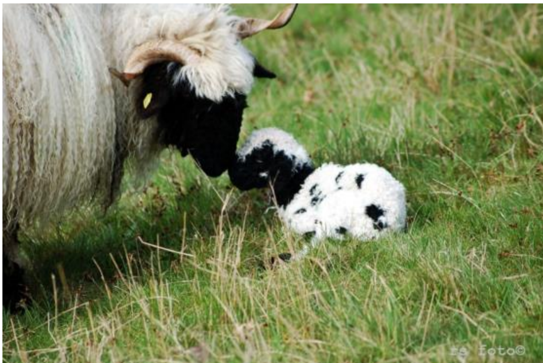
Schafe am Rundweg