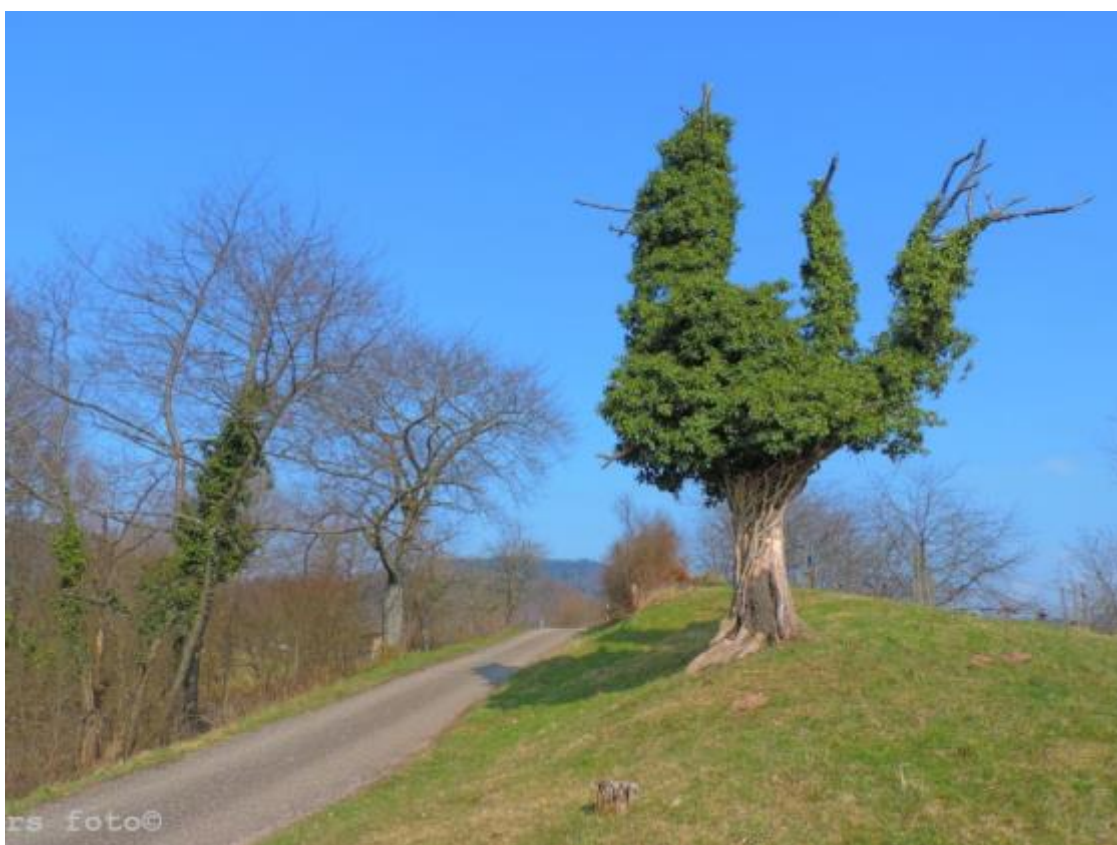
Umranker Baum kurz vor dem Pestkreuz