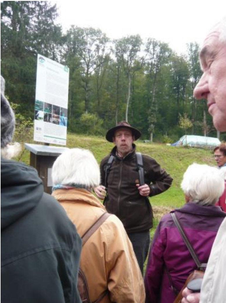
An dem Biotop bei der Bruecke