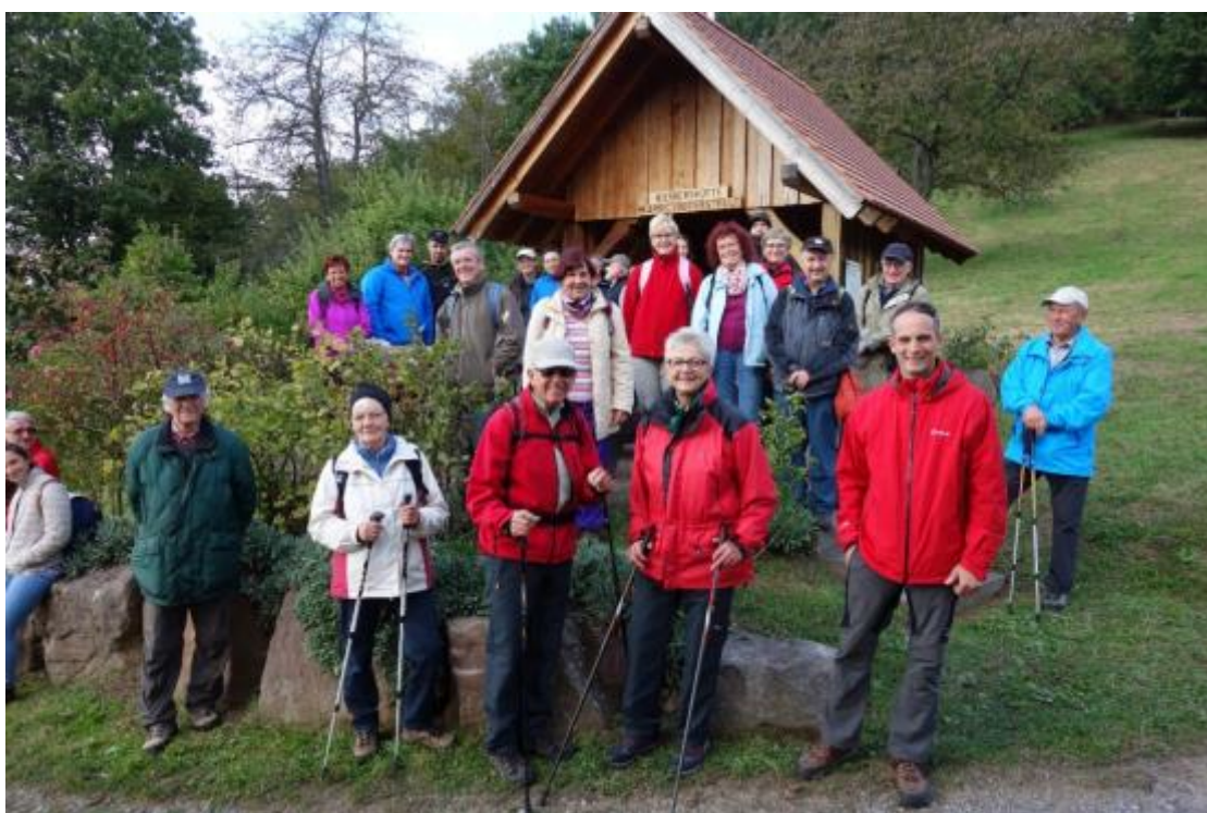
Dazu das Gruppenbild der Teilnehmer