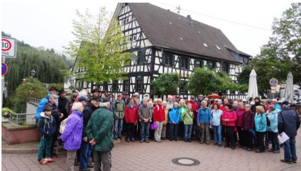
Geschafft, alle sind zum Gruppenbild vor dem Start versammelt