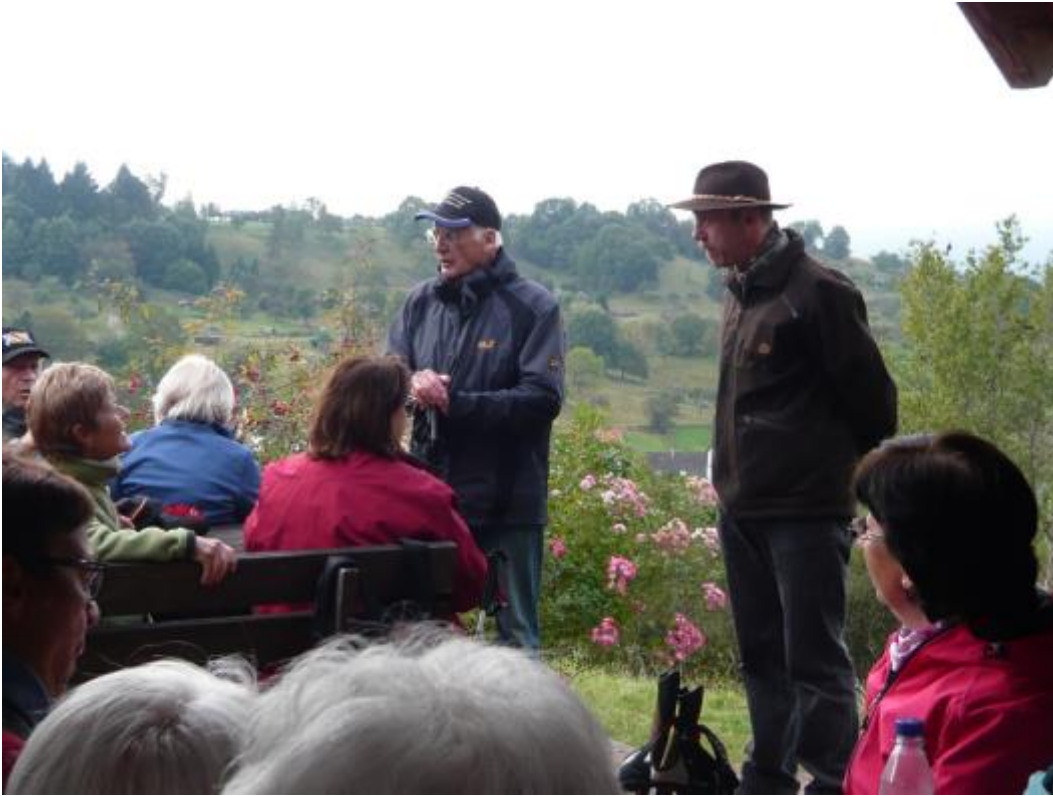
An der Hilsberg Huette mit schoenem Blick auf Michelbach